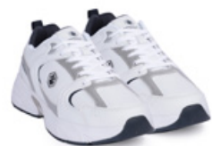
LUMBERJACK Ayakkabı - Shoes