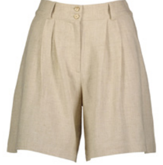
SHEFAME Şort / Shorts