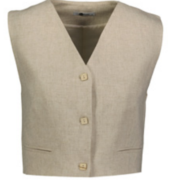
SHEFAME Yelek / West