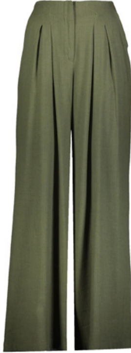
SHEFAME Pantolon / Pants