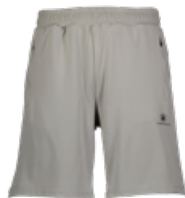
LUMBERJACK Şort - Shorts