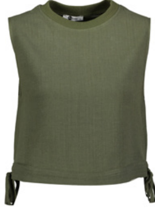
SHEFAME Bluz / Blouse

Shefame yeni koleksiyonuyla palazzo pantolonlardan klasik yeleklere birçok özel tasarımı birlikte sunuyor. Öne çıkan detaylar arasında ise klasik giyimin anahtar parçalarının özel kumaşlarla buluşması yer alıyor. Pamuk ve keten kumaşlardan tasarlanan tonsürton kıyafetler, ferah bir yaz etkisi yaratıyor. Her tasarımında şıklığı vurgulayan Shefame, özellikle ofis giyiminde tercih edilen klasik tasarımları, kendi stil kodlarıyla yorumluyor. Koleksiyonun öne çıkan tasarımlarında kum beji ve haki yeşili gibi pastel renklere oluşan ikili takımlar yer alıyor. Mevsimin vazgeçilmezi olacak şortlu yelek kombini ise çabası şıklığı özetliyor. Konforlu ve şık kombinler için Shefame tasarımlarını keşfedin.